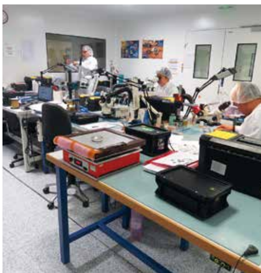
Une salle blanche de production

Si ces domaines sont les vôtres et que vous êtes passionnés par le spatial, n'hésitez pas à envoyer votre candidature à cette entreprise dynamique et pleine d'ambition.