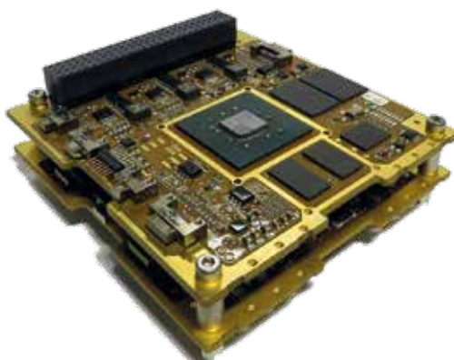
Calculateur MOBC NewSpace (Constellation KINEIS)