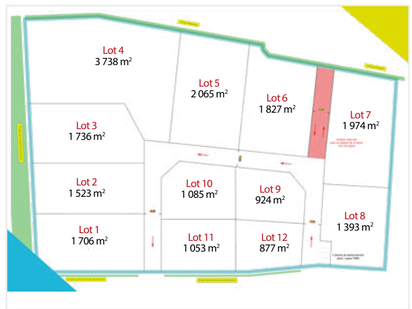
Parcelles disponibles sur la zone Coucours

Après avoir aménagé en 2019 une première tranche, la communauté de communes a pour projet d'étendre la zone d'activité Coucours. Cette extension d'environ 2,6 ha sera composée de 11 lots d'une superficie de 900 à 2400m 2 . La zone a vocation à accueillir de nouvelles entreprises type TPE/PME du secteur artisanal et tertiaire. L'aménagement et la pré-commercialisation de cette zone d'activité démarreront début 2023. Les porteurs de projet intéressés peuvent d'ores-et-déjà se rapprocher du service développement économique.