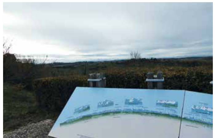
La table d'orientation