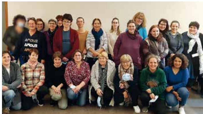
L'équipe des aides à domicile Cœur de Garonne

Si vous recherchez un emploi ou une reconversion professionnelle dans un secteur qui recrute, sachez que des postes sont à pourvoir. Les offres d'emploi sont consultables sur le site cc-coeurdegaronne.fr dans la rubrique « nous recrutons ». N'hésitez pas... ce métier d'avenir mérite d'être connu et reconnu !