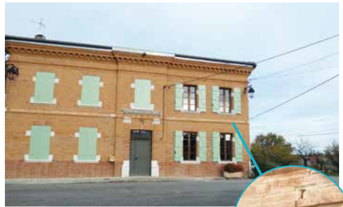
La mairie et ses bas reliefs

Au Pin Murelet, vous pouvez aussi acheter des produits directement à la ferme laitière, chemin du Fillol, tous les vendredis de 16h à 19h. Vous y trouverez la production de lait et de yaourts mais aussi des produits d'autres fermes comme du jus de pomme, du vin, des volailles ... Vous avez maintenant de bonnes raisons pour vous promener au Pin Murelet, la commune qui laisse toute sa place à la nature.