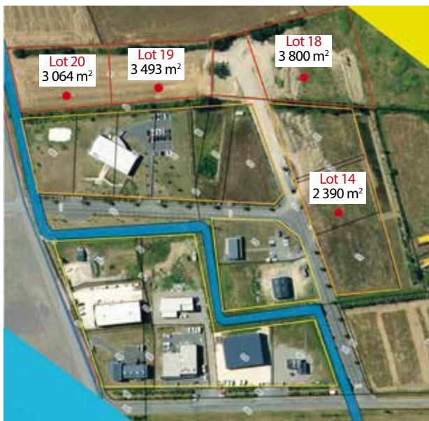
Parcelles disponibles sur la zone Descaillaux

La zone d'activité Descaillaux dispose d'un emplacement stratégique, en bordure de l'A64. Son accessibilité et sa visibilité depuis l'autoroute sont de forts atouts pour développer une activité économique ; sans oublier la proximité de pôles tels que Cazères et Le Fousseret où sont présents tous les services, commerces, écoles, collèges, lycée permettant et facilitant l'accueil de nouveaux collaborateurs.