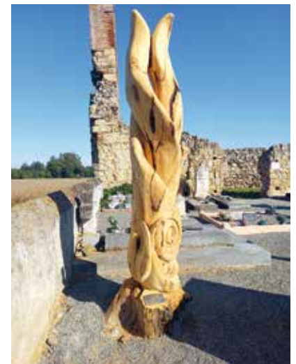
Sculpture sur cyprès