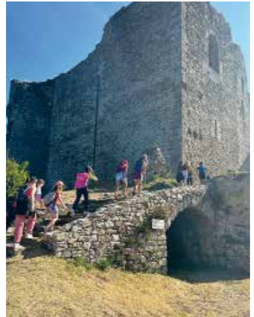
Visite de la forteresse de Najac, été 2023

Les équipes d'animation Coeur de Garonne encadrent une partie de ces séjours.