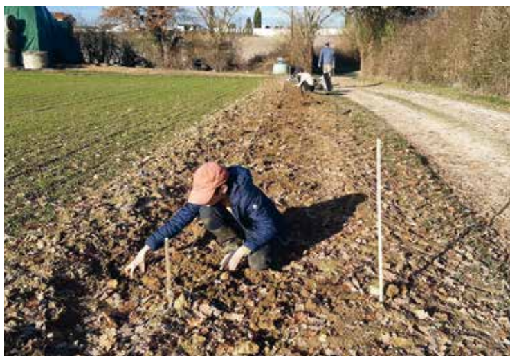
Plantation de haies