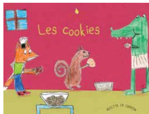
Couverture des deux livrets réalisés avec les dessins des enfants