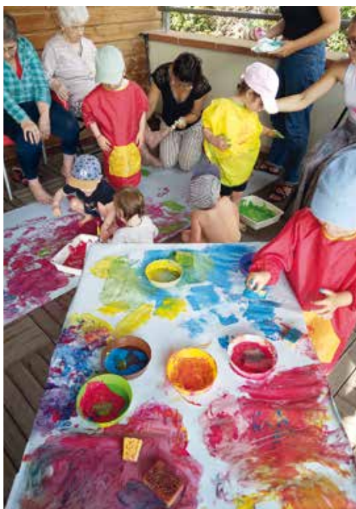
Atelier peinture à la maison petite enfance

Le mois suivant, les résidents sont à leur tour accueillis dans la