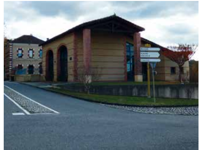
La mairie et la salle des fêtes

Ne passez plus à Couladère, arrêtez-vous !