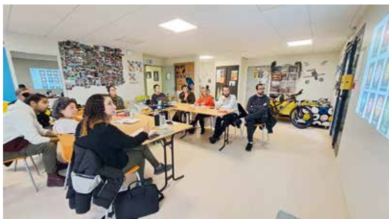
Les ambassadeurs en formation

France Connect vous permet de vous connecter à l'aide d'un seul compte à plus de 1400 démarches en ligne ! Si le logo France Connect apparaît sur un site cliquez dessus et connectez vous grâce à un compte unique : Ameli, Impôts, MSA, Identité Numérique, ou Yris. Cette méthode sécurise vos démarches et vous évite un énième mot de passe à retenir !