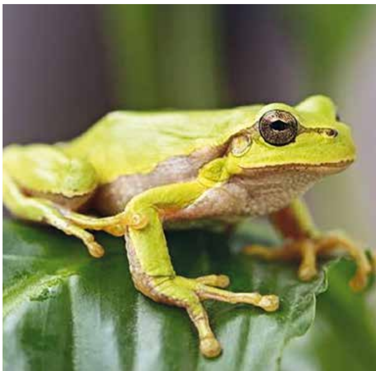
La rainette méridionale

Si vous souhaitez découvrir ces quatre documents fascinants qui vous dévoileront les espèces d'amphibiens, les pelouses, les rapaces, et les insectes de la région, rendez-vous sur https://tourismecoeurdegaronne.com/notre-nature-et-sa-biodiversite/