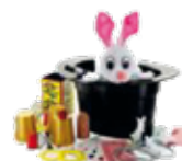
Jouets d'exploration et autres jouets