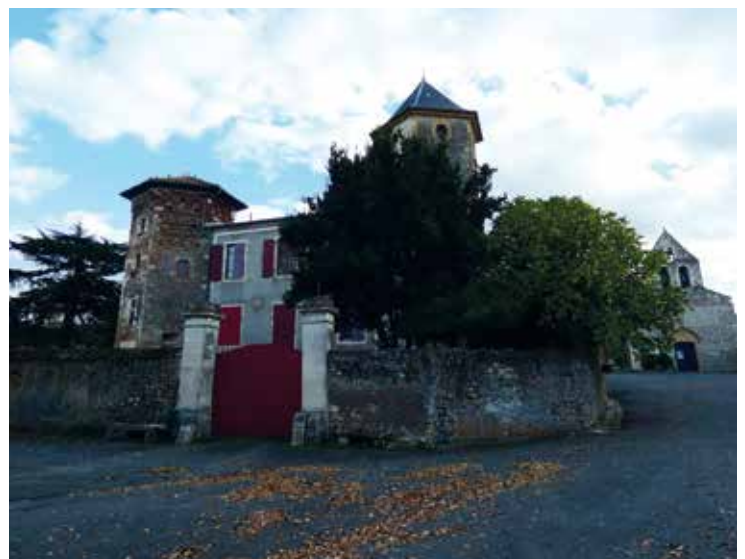
Le château et l'église