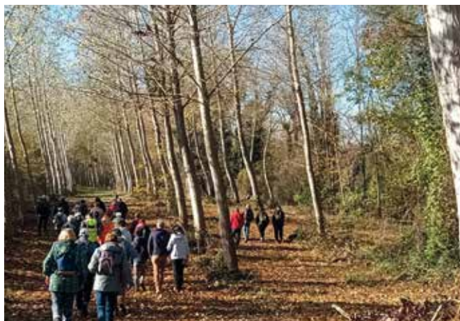
Randonnée à Palaminy

L'écotourisme favorise la protection des zones naturelles en créant des avantages économiques et d'autres possibilités d'emplois et de sources de revenus pour les populations locales mais aussi en faisant davantage prendre conscience aux habitants comme aux touristes de la nécessité de préserver le capital naturel et culturel.