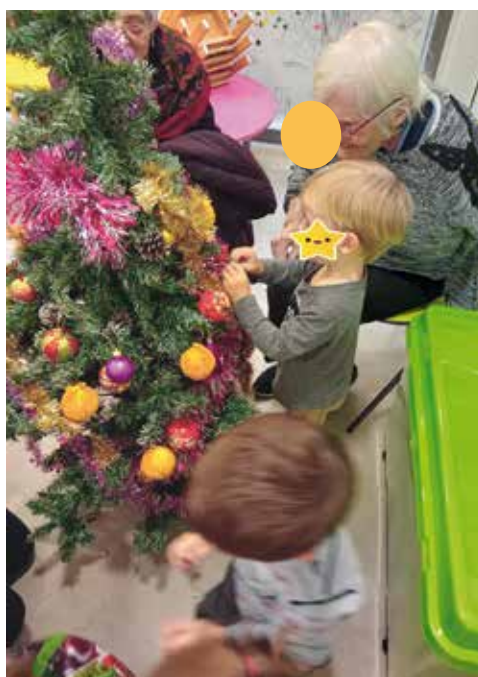
Décoration du sapin de Noël

Une fois par mois des résidents de l'EHPAD viennent à la rencontre des enfants dans les locaux de la crèche. Prendre un minibus pour arriver jusqu'à la crèche est déjà une aventure ! Pour les enfants, rencontrer des personnes très âgées est une expérience enrichissante. D'abord intimidés, les enfants apprennent à communiquer avec les personnes âgées à travers des chants et des comptines.