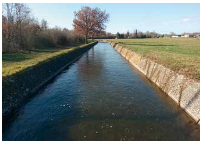
Le canal de Saint-Martory à Lherm

En 2023, l'offre de randonnée de Coeur de Garonne s'est encore étendue. Aujourd'hui, ce sont plus de 300 km de sentiers et 34 circuits bouclés tous niveaux que vous pouvez parcourir