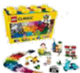
Jeux de construction