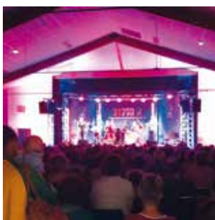
22 août au Fousseret 31 Notes d'été