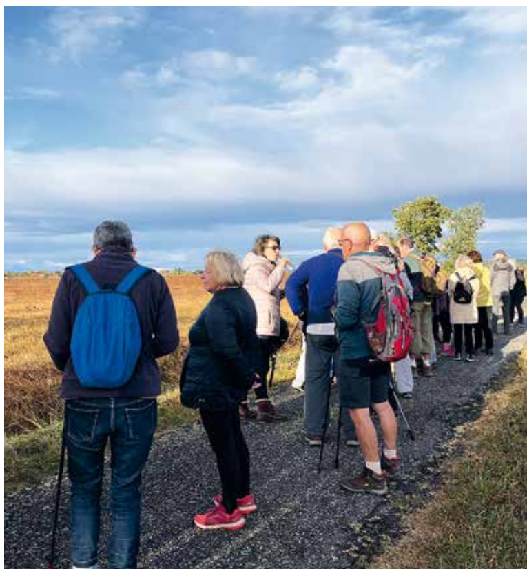
Randonnée à Saint-Elix-le-Château, automne 2023

Mais, rappelons que durant l'été et l'automne 2024, des balades nature, des visites commentées seront proposées par l'Office de Tourisme Intercommunal, à tous les habitants du territoire Coeur de Garonne.