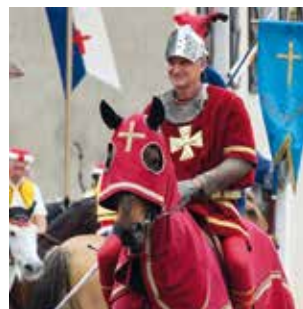
26 mai à Martres-Tolosane reconstitution historique de la bataille de Saint-Vidian