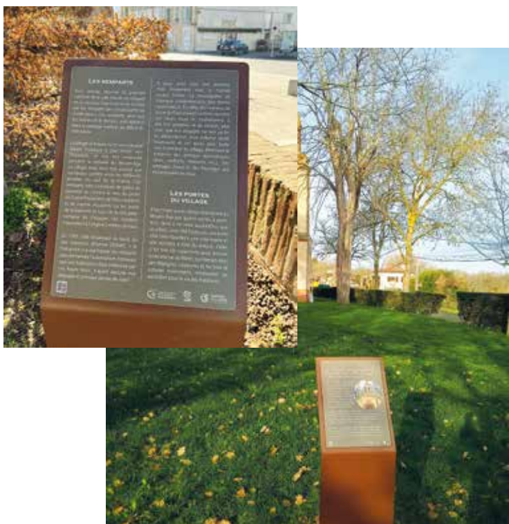
La chapelle de Lormette à Rieumes

Cette action, financée par la communauté de communes, se poursuivra sur d'autres communes du territoire pour le plus grand plaisir des habitants, des visiteurs et des touristes qui y découvrent notre identité historique.