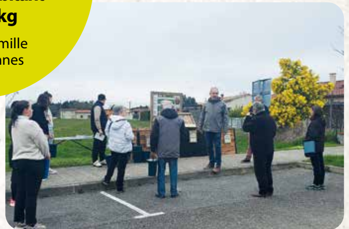
Inauguration à Saint-Elix-le-Château

Pour retrouver les emplacements de ces aires de compostage sur https://www.cc-coeurdegaronne.fr/