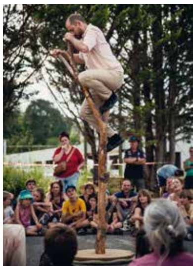
Cie leto

Enfin le concert de Gabriel Saglio proposé par la Maison de la Terre clôturera la journée dans une ambiance festive et conviviale.