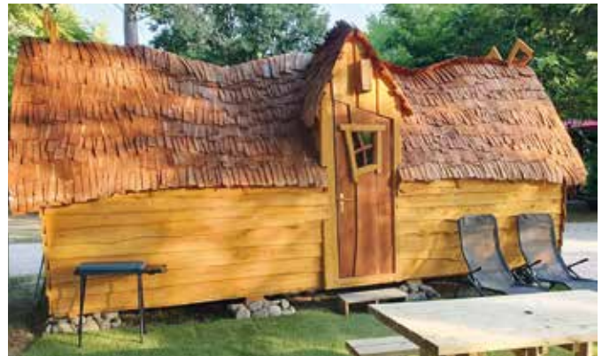
La cabane magique du Moulin