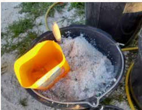
Les pots de yaourts broyés

Il existe beaucoup de possibilités de récupération et je n'ai pas assez d'une vie pour mettre à exécution toutes mes idées ! "