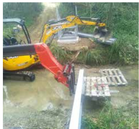
Installation d'une passerelle