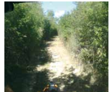
Le chemin avant et après le passage de Jérôme