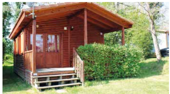
Le chalet du Casties