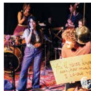
Les festivals de la Maison de la Terre à Poucharramet lamaisondelaterre.fr