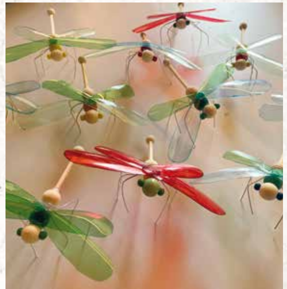
Création à partir de bouteilles en plastique

" Mes ateliers sont complets, ce qui prouve bien l'intérêt des personnes pour le réemploi. J'interviens aussi dans les écoles avec pour objectif de créer en s'amusant tout en réduisant les déchets car la colle est la seule matière première à acheter "