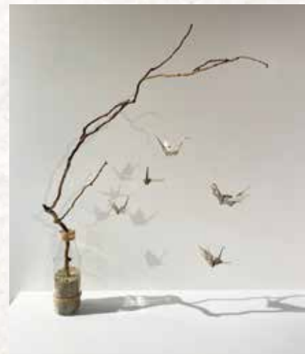
Création avec des pages de livres et une bouteille en verre