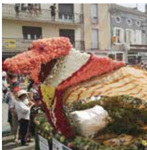
20 mai à Cazères Fête des fleurs de Pentecôte, corso fleuri