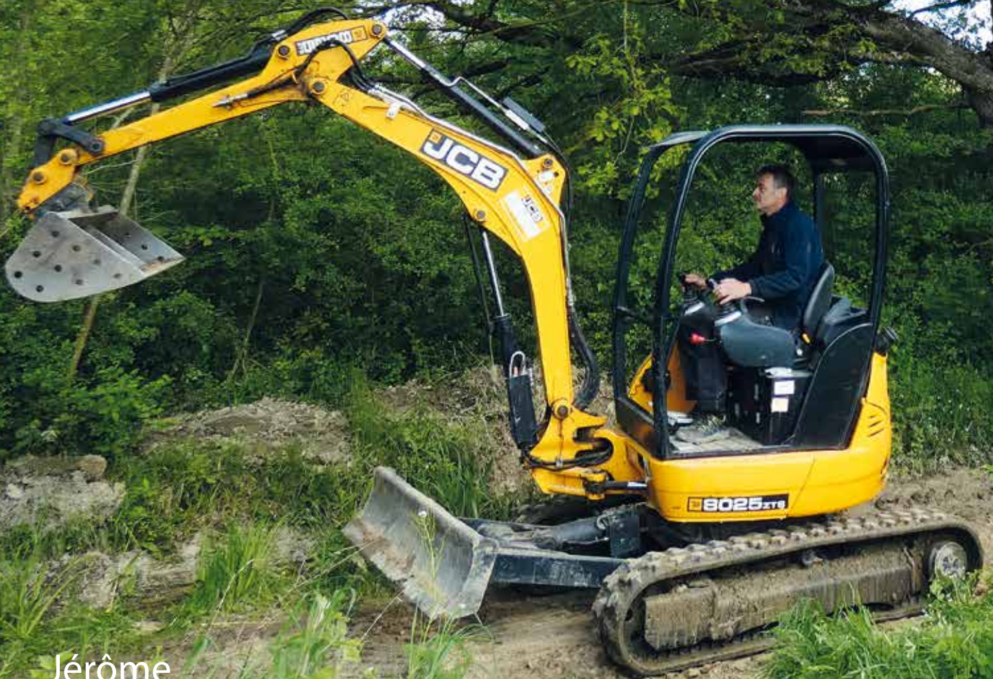
Jérôme A Sainte-Foy-de-Peyrolières