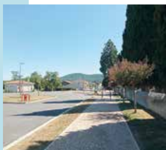
Aire de Martres-Tolosane

Retrouvez les infos sur https://tourismecoeurdegaronne.com/