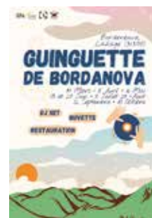
13, 27 juin / 11 juillet / 29 août / 12 septembre de 18h à 22h30 à Lahage