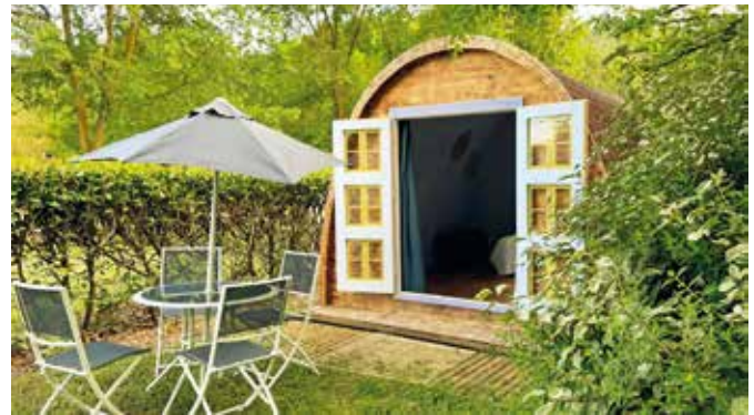
Le Pod du Moulin