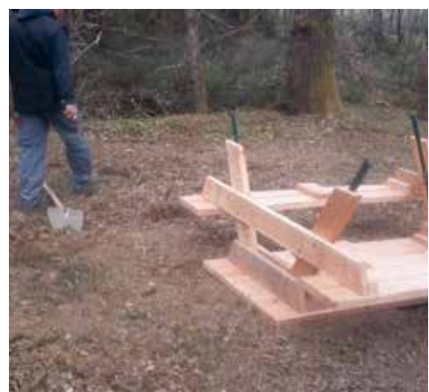
Installation d'une table de pique-nique