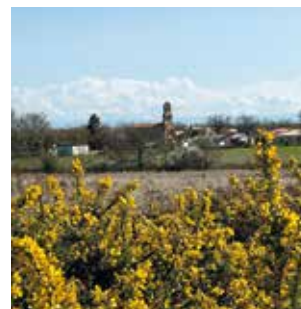
31 mai, 1 er & 2 juin RDV aux jardins