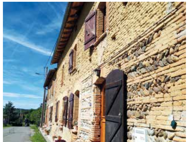
Une maison typique en briques et galets