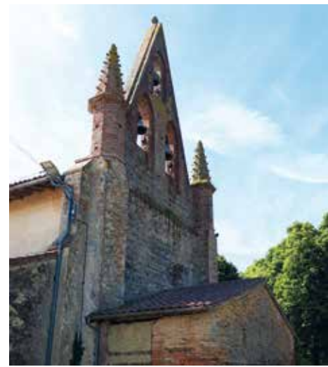
Le clocher mur

Vous l'aurez compris, si vous recherchez le calme, la nature, venez vous perdre à Savères, vous repartirez sous le charme !