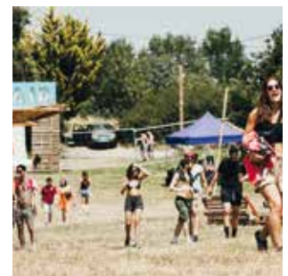
5, 6, 7 juillet à Saint-Araillé Bel Air Festival belairfestival.fr